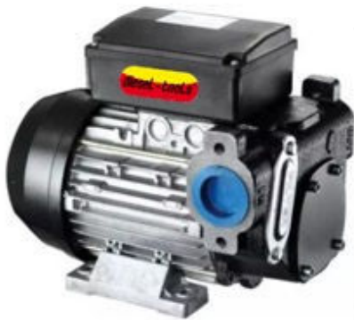
PUMA 72 L/MIN