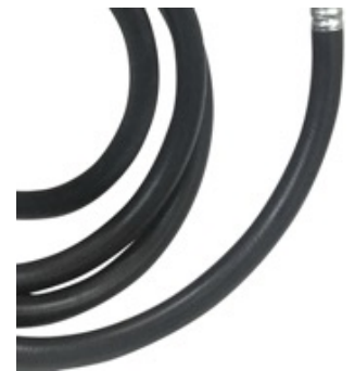
OPTIE 6 METER SLANG OPTION 6 METER HOSE