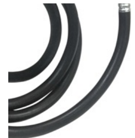
OPTIE 6 METER SLANG OPTION 6 METER HOSE